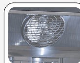
Ventilatore interno di assistenza