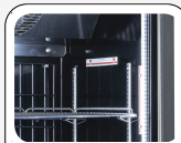
Luce LED interna