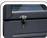
Serratura di serie