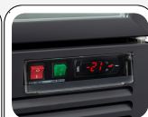
Interuttore generale, interuttore luce e termostato digitale di serie